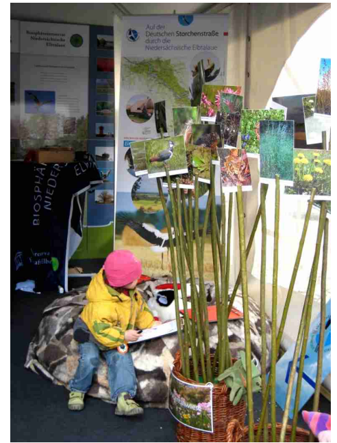
Der Messestand in Braunschweig sprach auch die kleinen Besucher an

Die Artenvielfalt der Elbtalau konnten die Teilnehmer am Europäischen Tag der Parke am 24. Mai vor Ort erleben. Rund 150 Bewohner und Gäste der Region ließen sich zu Fuß bzw. auf dem Fahrrad bei sechs Führungen die verschiedenen Lebensräume erläutern. Die Palette reichte von der Geestinsel Hühbeck, den Dünen des Carrenziener Forsts, dem Elbvorland und den Sudewiesen bis zur Dannenberger Marsch. Besonders die Abendexkursionen waren sehr nach-