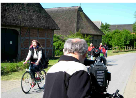
Die Radfahrergruppe passiert den Kameramann des NDR-Fernseh-Teams

„Ruhe, Kamera läuft“, so hieß es vor wenigen Wochen, als das NDR-Team einen wunderschönen Sommertag in der Elbtalaue verbrachte, um auf der Deutschen Storchestraße eine Gruppe Radfahrer zu begleiten.