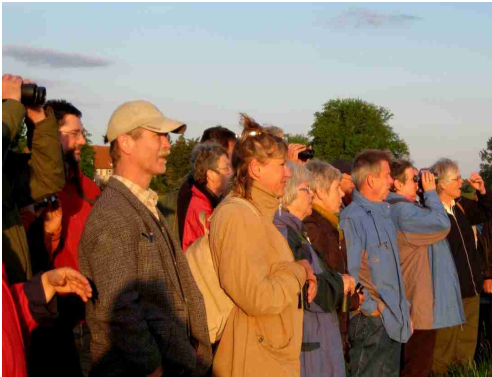
Zahlreiche Gäste kamen - hier in der Abendsonne - zu den Führungen am Tag der Parke

Diesen Aspekt stärker ins Bewusstsein zu bringen war ein