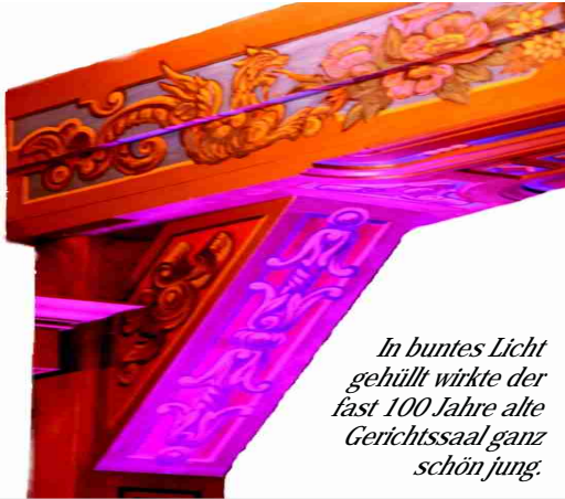
In buntes Licht gehüllt wirkte der fast 100 Jahre alte Gerichtssaal ganz schön jung.