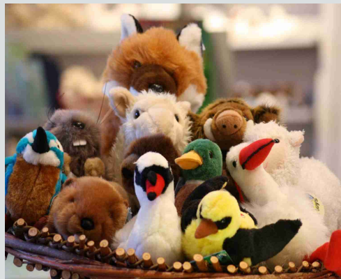
Vertreter der heimischen Fauna - hier im Shop des ElbSchlosses sitzen sie alle ganz friedlich vereint beieinander.

Bei der Auswahl der Plüschtiere von ganz unterschiedlichen Firmen legen wir – neben dem Kuschelfaktor – großen Wert auf eine solide Verarbeitung und eine möglichst naturgetreue Nachbildung der Arten – auf lila Kühe müssen Sie bei uns also garantiert verzichten!