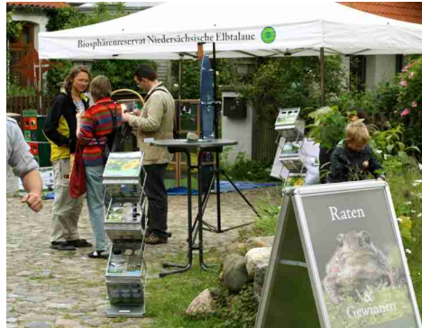
Ob in Hitzacker (oben) oder in Lüneburg, immer konnten sich die Besucher informieren und selbst aktiv werden.

berg Ende Juni. Hier durften die kleinen wie großen Besucher sich bei verschiedenen Experimenten mit Wasser ausprobieren und forschen.