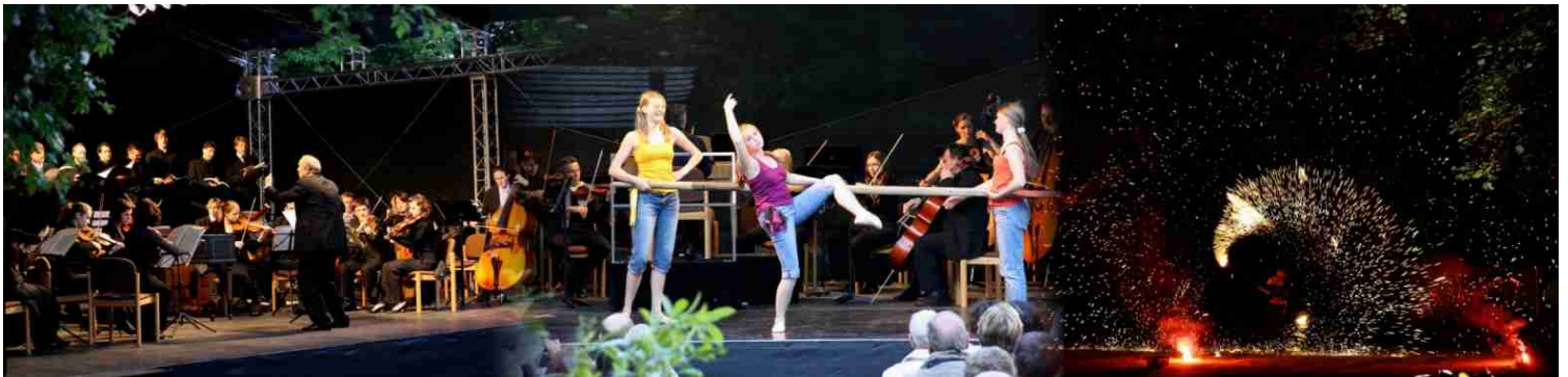
Orchester und Chor der HMT Hannover, drei junge Damen tanzen vor den Lüneburger Sinfonikern zu Händels Wassermusik und Feuerjonglage im Schlosspark zum Mittsommernachtsfest (von links nach rechts)

Wenn verschiedene Organisationen und viele Menschen zusammen arbeiten, ist das nicht immer eine Garantie für gelungene Ergebnisse. Anders beim QiN-Projekt in Bleckede, QiN steht dabei für "Quartiersinitiative in Niedersachsen". Seit letztem Herbst arbeiten die Stadt, die Werbegemeinschaft Handel und Handwerk und das Elb Schloss zusammen mit Bürgerinnen und Bürgern an verschiedenen Projekten zur Belebung der Innenstadt. Mit der wechselnden Dekoration zweier derzeit nicht nutzbarer Ladenlokale sind erste Ergebnisse sichtbar. Bis Ende August kommen noch die Neugestaltung des Weges vom "Flaggenmast" durch die Hartmanns-Twiete zur Innenstadt, neue Wegweiser und Stelen mit Informationen zur öffentlichen Infrastruktur sowie neugestaltete Informationskästen an sechs Standorten mit Inseraten aus Beherbergung, Gastronomie und Freizeit hinzu.