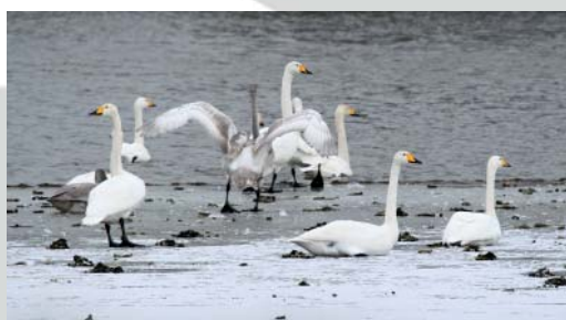
Singschwäne in der Elbtalau

Doch um welche Arten handelt es sich genau? Von woher kommen die Vögel in die Elbtalau und warum? Und welche