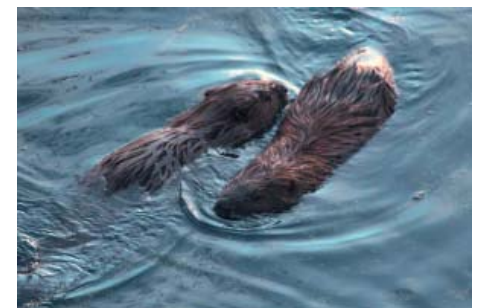
Biberbegegnung im Teich des Biosphaeriums

Da Biber ihr Revier verteidigen, war ein kompletter Tierwechsel angebracht. So