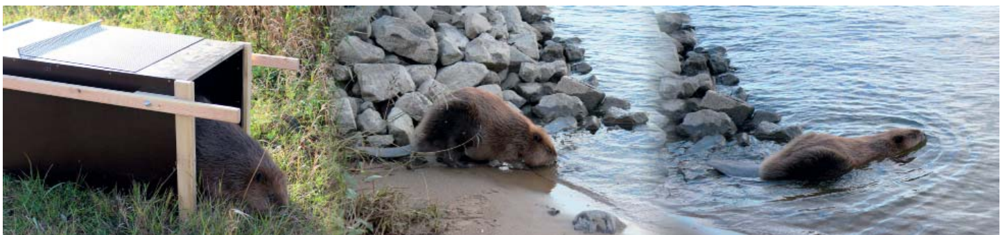
Aus der großzügigen Transportkiste direkt an den Strand und dann ein erstes Bad im großen Strom - die Auswilderung unseres bisherigen Bibers in die Elbe

wurde der zwischenzeitlich in Bleckede einzeln gehaltene Biber in Zusammenarbeit mit der Biosphärenreservatsverwaltung in der Elbe ausgewildert. Nachdem er einen ersten Blick aus der Transportkiste wagte, ging er zügig in der Elbe schwimmen.