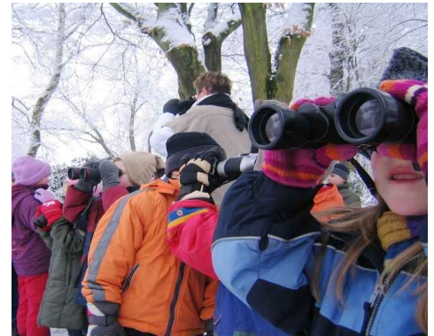
Der Umgang mit dem Fernglas will gelernt sein - und macht auch im Winter Spaß!

strukturierten - Website finden Sie viele weitere Programme, zudem ab Mitte November die Aktionen für die Weihnachtsferien. www.elbschloss-bleckede.de