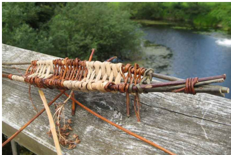
Kleine Flechtwerke, z.B. in Form eines Bootes fertigen Schülerinnen und Schüler selbst

„Gans wild“ unterwegs in der Elbtalaue sind Kinder wie auch Jugendliche von Oktober bis März. Dabei ergeben sich spannende Gelegenheiten, gefieder-